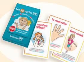
Les 30 cartes IPC