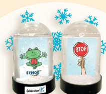
Boule à neige