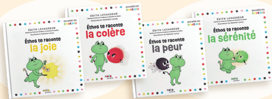
Série ACCUEILLE TES ÉMOTIONS Éthos te raconte la joie, la colère, la peur et la sérénité

C'est donner aux enfants les clés pour comprendre, exprimer et réguler leurs émotions.