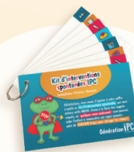
Kit d'interventions spontanées