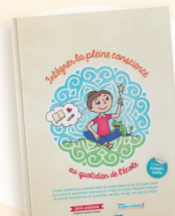
Intégrer la pleine conscience