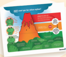
L'affiche du volcan