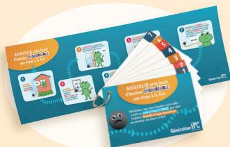
Kit d'accueil des émotions