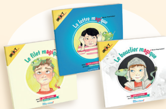
Le bouclier magique La lettre magique et Le filet magique