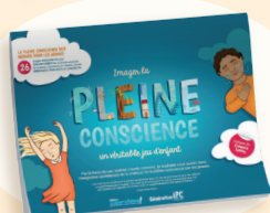
Imager la pleine conscience